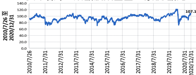
— 安本標準 - 東歐股票基金 A 累積 歐元