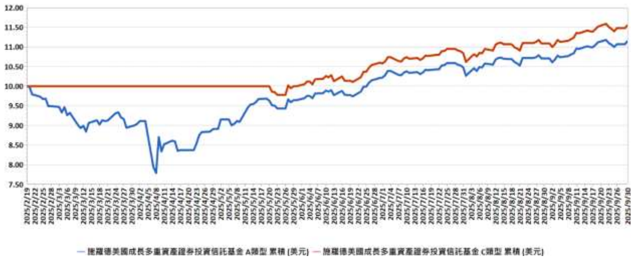
A 類型新台幣計價(累積型)及 C 類型新台幣計價(累積型)受益權單位每單位淨值價值之走勢圖 (114 年 9 月 30 日)